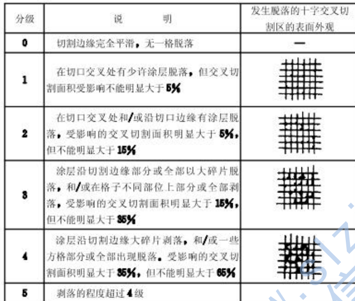
表 E.0.7 试验结果分级

E.0.7 试验结束后应对试验结果评级。在良好的照明条件环境中，应用正常的或校正过的视力，或应经过有关双方商定用目视放大镜仔细检查试验涂层的切割区，应按表 E.0.7 进行试验结果评级。